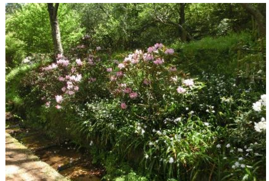
石楠花（ピークを過ぎ花は少なかった）